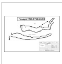
Карта 1975 год Автор Цыкина Ж.Л. с компьютерной обработкой КККС