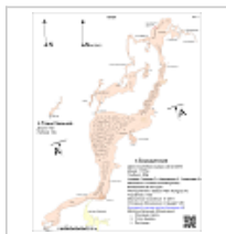
План с Бородинской План с взаимным расположением Бородинской и Таинственной (АКС 2016)