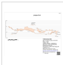
Разрез с Бородинской Разрез с взаимным расположением Бородинской и Таинственной (АКС 2012)