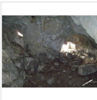
Вход Автор: Вид из пещеры

Внес в ИПС - Гриднев Павел 8 декабря 2025 в 03:29