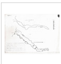
Карта 1991 год Автор Миллер О.В.