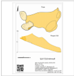
План и разрез Абаканский клуб спелеологов 2015 год