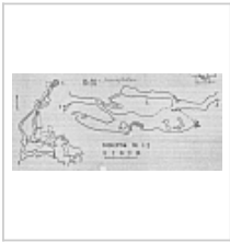
Топосъемка Топосъемка из Кадастра карстовых полостей массива Фишт (1986 г.)