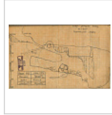
Разрез Из отчета А.Е.Петрова 1974 г.