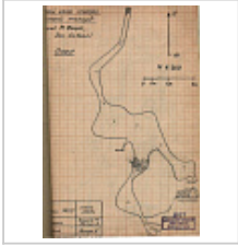
План верхнего этажа Из отчета А.Е.Петрова 1974 г.