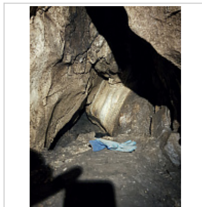
узость в конце