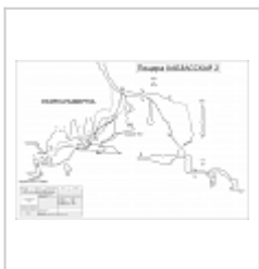
Хабзасская II разрез Разрез развертка пещеры Хабзасская II