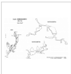
Съемка пещеры Хабзасская II План и разрезы пещеры Хабзасская II