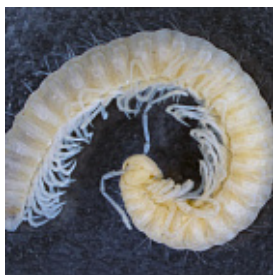
Caucaseuma lohmanderi Strasser, 1970