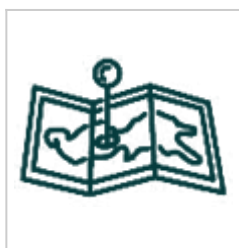
Модели Модели KML, LOX, 3D