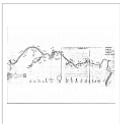
Су-Акан план Су-Акан план 1982 года