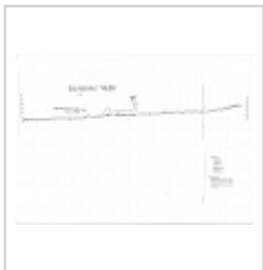
Су-Акан разрез-развертка Су-Акан разрез-развертка 1982 года