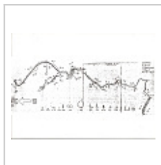
План 1982 Су-Акан план 1982 года