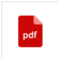
План 2018 года План создан в результате оцифровки карты 1982 года с новыми ходами снятыми в 2009 году