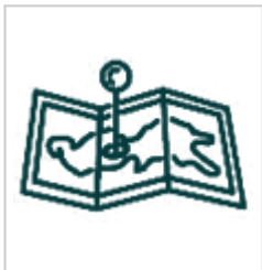
Модели Модели KML, LOX, 3D