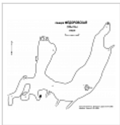
План пещеры План пещеры Федоровская