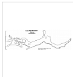
Развертка пещеры Разрез-развертка пещеры Федоровская