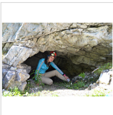
Вход в пещеру Иконникова