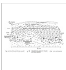
Схема-сечение пещеры Болотниковская ФГУП "Волгогеология", 2003