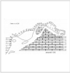
План Болотниковской пещеры ФГУГП "Волгогеология", 2003