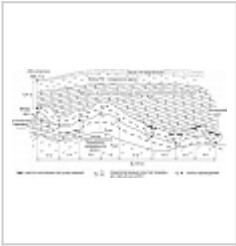
Схема-сечение пещеры Болотниковская ФГУГП "Волгогеология", 2003