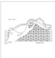
План Болотниковской пещеры ФГУП "Волгогеология", 2003