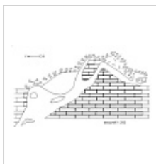
План Болотниковской пещеры ФГУП "Волгогеология", 2003