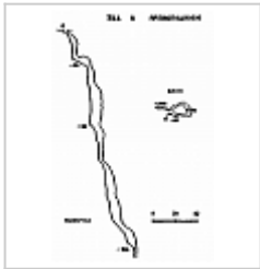
Ход в преисподнюю План и разрез-развертка.