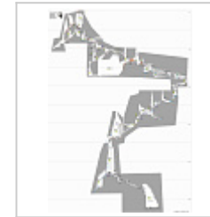
Схема навески + СТО

По материалам съёмок 2003-2007 гг. Составил Вадим Ткаченко, с/к "Геликтит-ТМ".