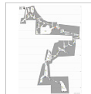
Схема навески + СТО Составил Виталий Ракович, с/к "Геликтит-ТМ", 2005 г.

Разрез-развёртка По материалам съёмок 2003-2007 гг. Составил Вадим Ткаченко, с/к "Геликтит-ТМ".