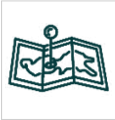
Берлога Объемная модель