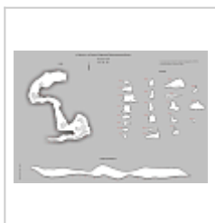
Берлога План, разрез