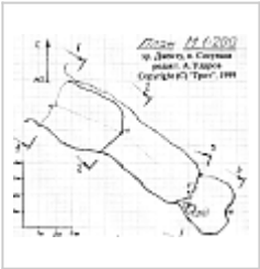
Сосулька План пещеры

Вход в пещеру — живописная арка внушительных размеров (6х6 метров в сечении) находится в скальном борту крутого кулуара в южной стене Большого Каньона.