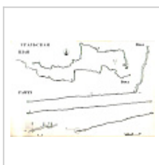
Уральская. План, разрез Съемка СГС 1980-1982