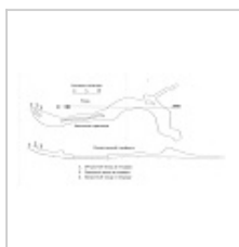
Нежная План и профиль. Автор С.П. Лозовой