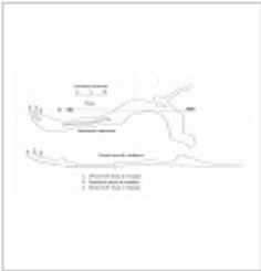
Нежная План и профиль. Автор С.П. Лозовой