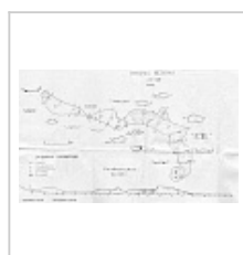
Нежная План, профиль, сечения.