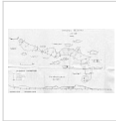
Нежная План, профиль, сечения.