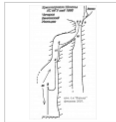
Схема навески КС МГУ, 1998.