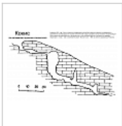
Разрез-развёртка По материалам грузинских спелеологов.