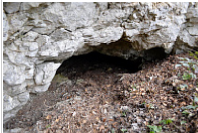
Вход - Западный портал