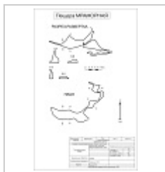
ККС За основу взята карта АСС 1971 г.