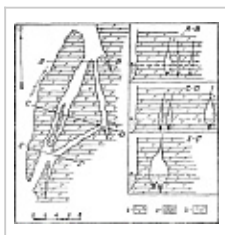
План и разрезы Полазнинской пещеры по Печеркину И.А., 1965 г.