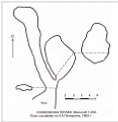
Пещ. Куликовская Тёплая (план) Печеркин И.А., 1963 г.