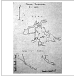
План и разрезы пещеры Кичменская 1970-е гг.