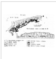
План и разрез пещеры Нижнемихайловская По материалам ЧО УКСЭ, 1974