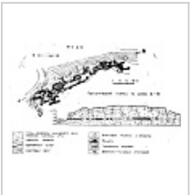
План и разрез пещеры Нижнемихайловская По материалам ЧО УКСЭ, 1974

Пещера имеет два вход. Пещера представляет собой сложную систему ходов и небольших гротов-расширений.