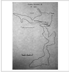
Схема пещеры Кашинская по материалам 1969 г.