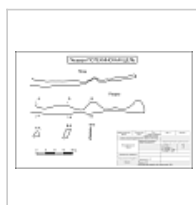
Компьютерная обработка под редакцией Бурмака И.Н. Компьютерная обработка Кириченко С.В.