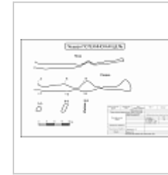
Компьютерная обработка под редакцией Бурмака И.Н. Компьютерная обработка Кириченко С.В.