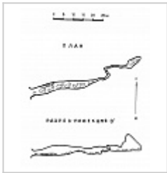
Карта пещеры Карта пещеры