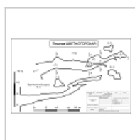
Компьютерная обработка под редакцией Бурмака И.Н. Компьютерная обработка Кириченко С.В.