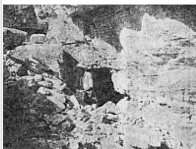
Вход в Тураевскую пещеру.

из статьи Варсанофьевой В.А. Карстовые явления в северной части Уфимского плоскогорья.