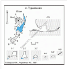
Пещ. Тураевская (план и разрезы) Лавров И.А., Черемных А.Г., 1991 г.

Вход расположен в борту коренной террасы старого русла р. Ирень. Ближняя часть пещеры разрушена кустарной добычей гипса. Вход имеет форму неправильной трапеции, шириной 4 м и высотой 2,4 м. Далее ход приводит в круглый грот со сводчатым потолком, где расположено озеро. За озером находится продолжение пещеры (Панарина, 1973).