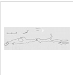
Бязская, план Составлен Матрениным С. и Цурихиным Е. в 1985 г.