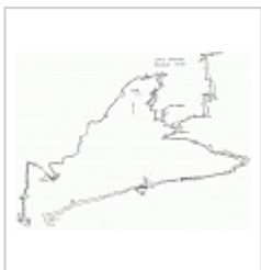
план и разрез Томская(?) калька