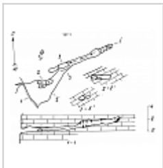
План и разрез План и разрез