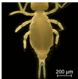
Arrhopalites macronyx Vargovitsh, 2012