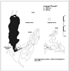
План Ручная План пещеры Ручная

Вход в пещеру находится в борту большой воронки (вскрыт искусственно), по проходам в глыбовом завале и меандрам доходим до глубины 25м, далее следует уступ 8м (забит спит, требуется снаряжение), под уступом - средних размеров грот с уходящими вниз крутонаклонными катушками, одна из которых обрывается 15м уступом в озеро на дне пещеры. Проходимых продолжений на уровне воды не обнаружено, есть следы затопления пещеры на высоту до 40м от летнего уровня озера. Начиная с глубины 20м в пещере есть постоянно действующий водоток.