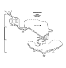
Схема Магна Глазомерная схема-разрез пещеры Магна. Составил Величко С.