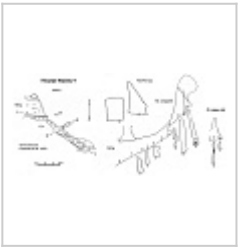
Юрмаш-1 План и разрезы 1979 год Алексеев В.А. Соколов Ю.В.