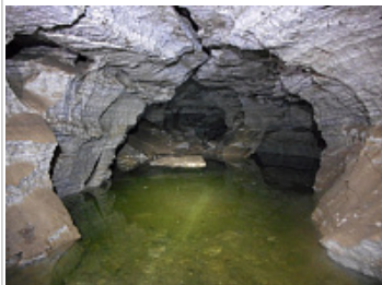
Караабызская пещера [ Благовещенская ] - Затопленный ход