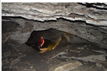
Караабызская пещера [ Благовещенская ]