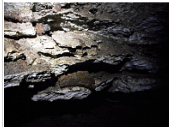
Караабызская пещера [ Благовещенская ] - Расслоившийся потолок