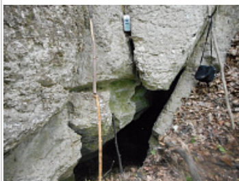
Караабызская пещера [ Благовещенская ] - Вход