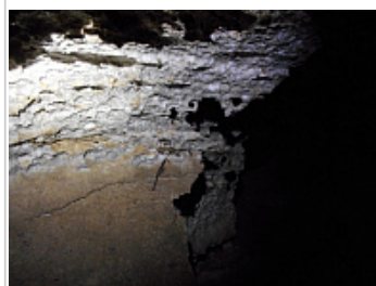
Караабызская пещера [ Благовещенская ]