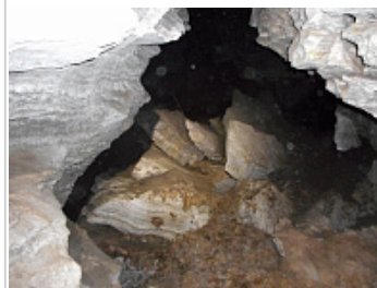
Караабызская пещера [ Благовещенская ] - Вход