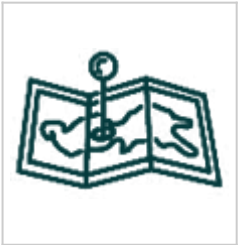
Модель пещеры Пожарная 3д модель