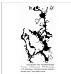
План среднего этажа Кизеловской пещеры Кузнецова Л.С., Митюнин Ю.К., Армишев В.М.