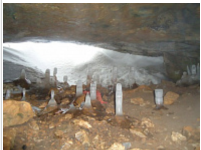
Вход (старый) в пещ. Кизеловская . Вид изнутри