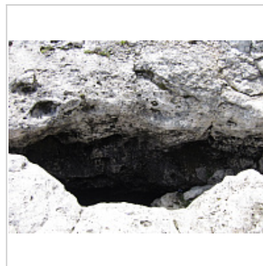
Снимок, на котором была найдена маркировка МГУ 99-6 (белые буквы и цифры на серой стене, немного выше и правее центра кадра)