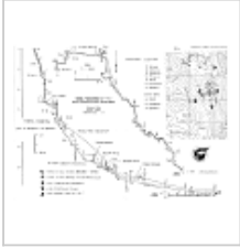
План и разрез- развертка Топосъемка Спелеоклуба МГУ, 1999-2000 гг.