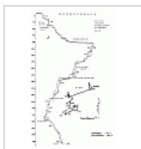
Московская план&разрез 92 план и разрез 92 до 970м