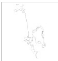
московская план 1:200 2001г План 1:200 экспедиция "Гонзо" рук. Чегодаев