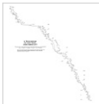
Московская сто Московская СТО Чегодаев 2001