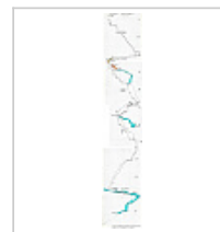
Московская р-рз 1250 разрез с добавлением исследований 2010 . Демидов, Кузьмин