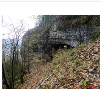
Вход в пещеру Тихого Камня