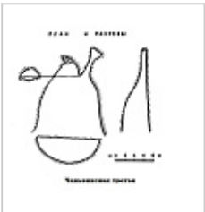
Пещ. Чаньвинская 3 (план и разрезы) Шумков В.М., 1965 г.

Вход в пещеру обращен на север к р. Чаньве. Ширина его около 17 м, а высота до 6 м. Пещера сухая и светлая. Свод её вначале арочный, а далее плоский.