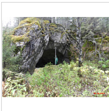
Вход в пещ. Большая Всеволодовская