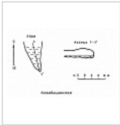
Пещ. Кладбищенская (план и разрез) Панарина Г.Н., 1973 г.