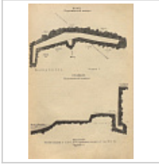
Пещ. Подкаменская Малая (план и профиль) Сысоев А.Д., 1940 г.