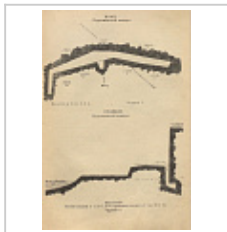
Пещ. Подкаменская Малая (план и профиль) Сысоев А.Д., 1940 г.