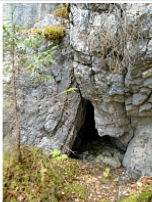
Вход в пещеру