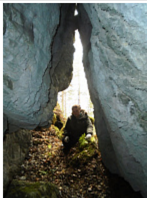
Вид на вход изнутри

Внес в ИПС - Адеева Светлана 7 декабря 2025 в 18:53