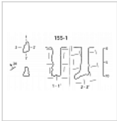
155-1 План и разрез