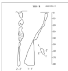
160-18 План и разрез