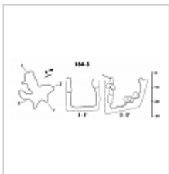
160-3 План и разрез