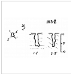
163-2 План и разрез